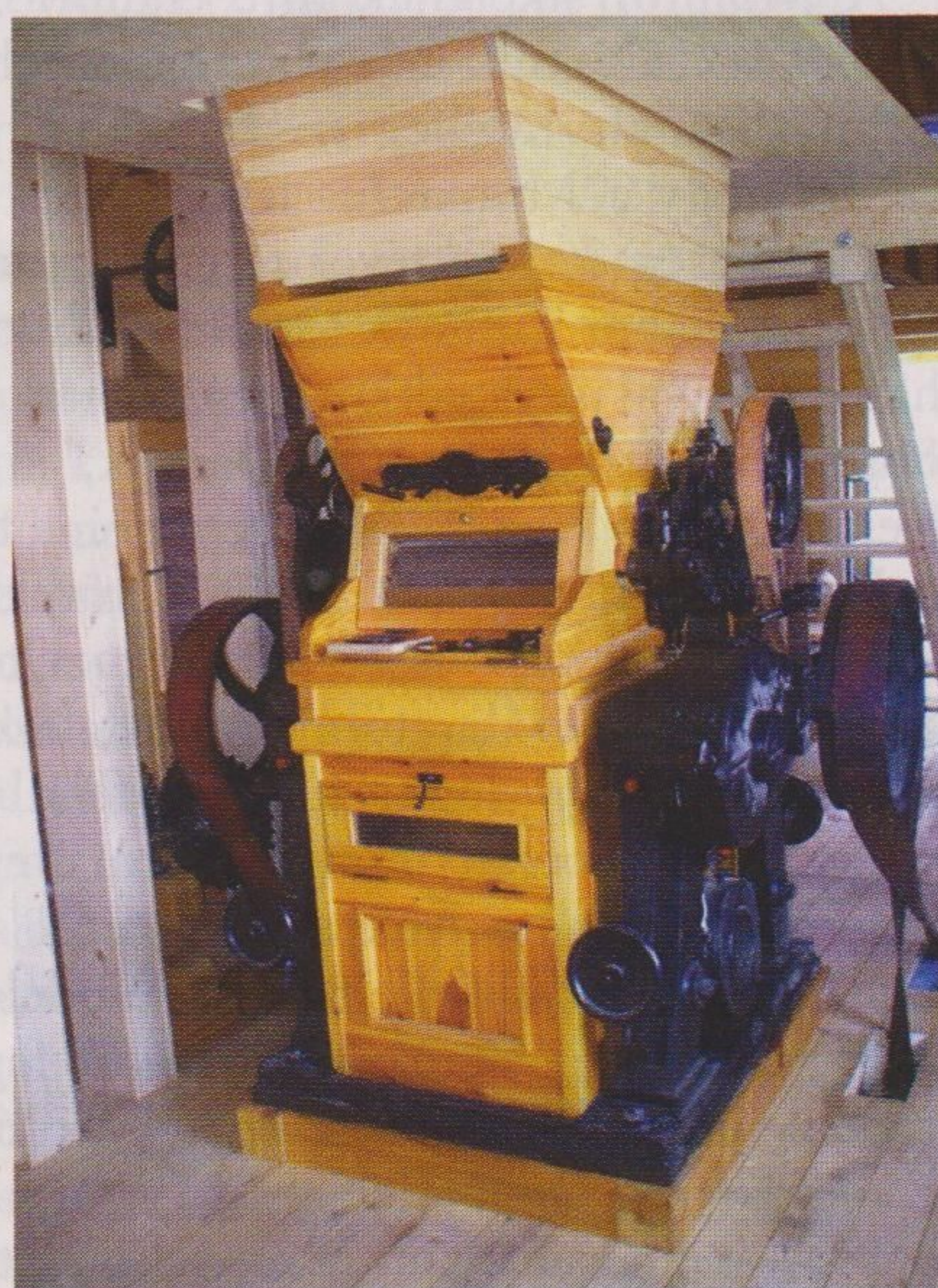
Egyedülálló élmény példátlan civil összefogásból. A muzeális értékű berendezéseket felkutatták, s az ország minden tájáról begyűjtötték, majd felújították azokat

zsa oktatásért felelős államtitkár köszöntője követ. A katolikus és református egyház főméltóságai megszentelik az új építményt, majd beindul az őrlési folyamat.