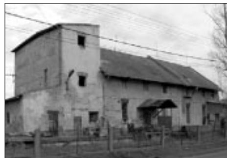
A ráckevei „Árpád-malom”

párkányok és szemöldökpárkányok díszítik. Belső terei gerendás, lapolt deszkamennyezetes és nyitott fedélszékes kialakításúak. Az egykori ipari épület impozáns tömege, külső-belső részleteképzése, területi elhelyezkedése és helytörténeti, valamint ipartörténeti értékei indokoltá tennék mind megőrzését, mind további hasznosítását.