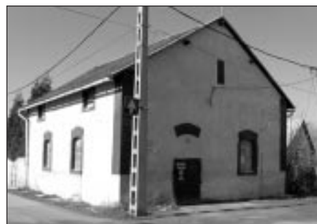
A Kálvin téri gabonátároló

Sajnos, az utóbbi pár évtizedben nagyon elhanyagolták, ezért jelenleg leginkább málló vakolata és rendezetlen környezete ragadja meg az arra járók tekintetét. Pedig a város egy másik hasonló korú épülete műemléki védeltséget élvez. A Kálvin téri gabonátárolót a mai napig használják, és viszonylag jobb állapotban található.