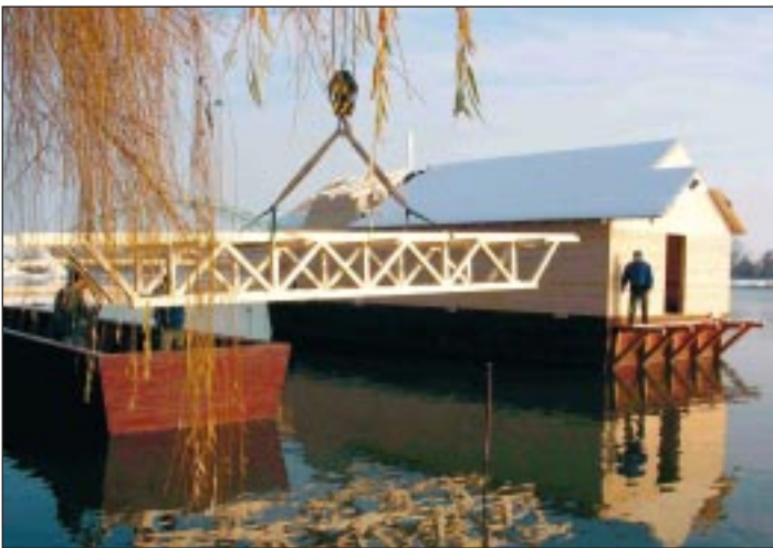
2009. december 17-én a Havária Kft. 25 tonnás daruja beemelte a mesterekbek által előre elkészített hídelemet és a 2,5 méter átmérőjű fogaskereket