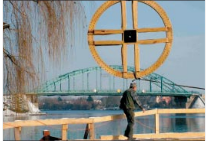
A mester és a kerék