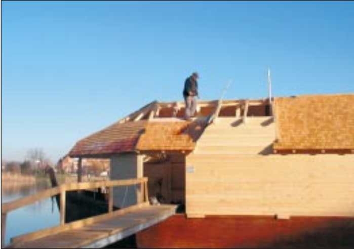
Egy pillanatkép a zsindelezésről