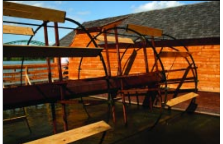
Forognak a hajómalom kerekei